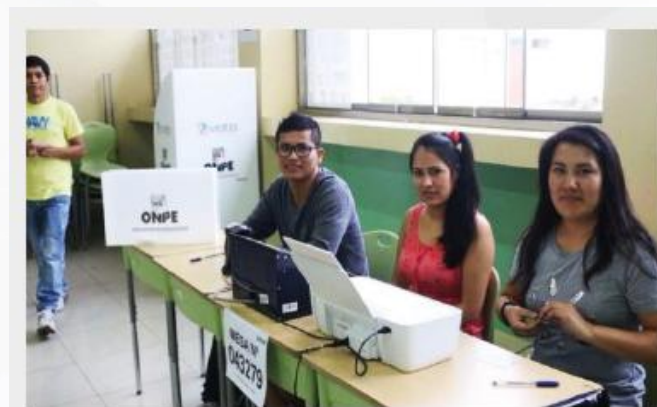
Miembros de mesa