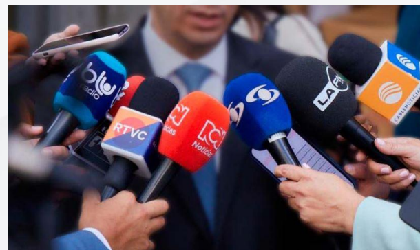
Medios de comunicación