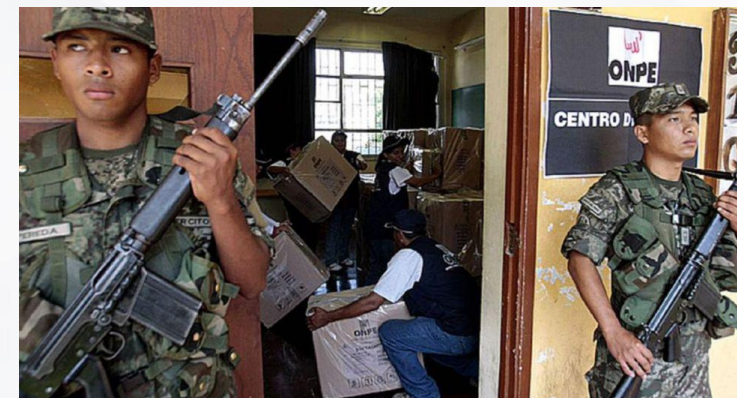
Fuerzas Armadas y PNP