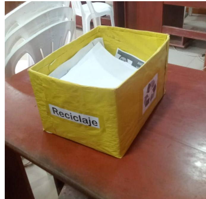
Subgerencia de turismo y promoción de inversiones

Se empezó a promover la disminución gradual de uso de papel en la Municipalidad provincial de Condorcanqui.