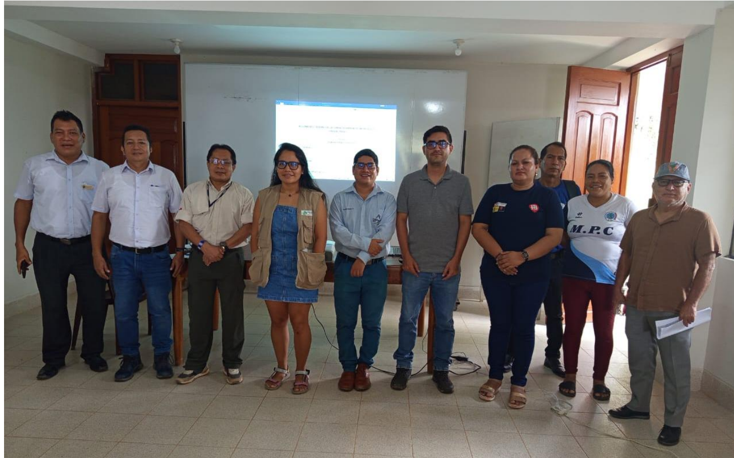
Reunión ordinaria de los miembros de la CAM 2025

Acuerdo de concejo N°078-2025-MPC aprueba la adecuación de la CAM Condorcanqui.