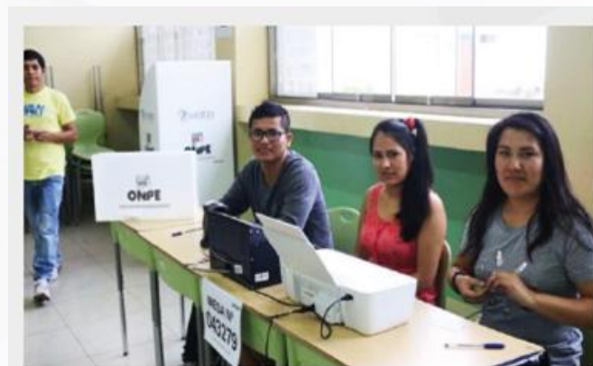
Miembros de mesa