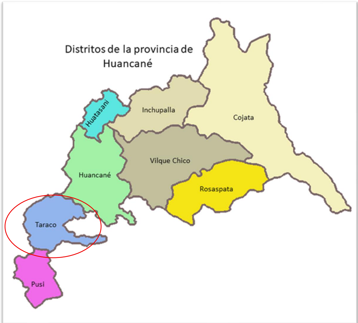
Imagen N° 1: Jurisdicción del Hospital en Taraco