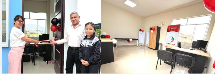
CENTRO DE SALUD MENTAL ESCOLAR INSTITUCIÓN EDUCATIVA N°2021561 VIRGEN de Lourdes - Jecuan