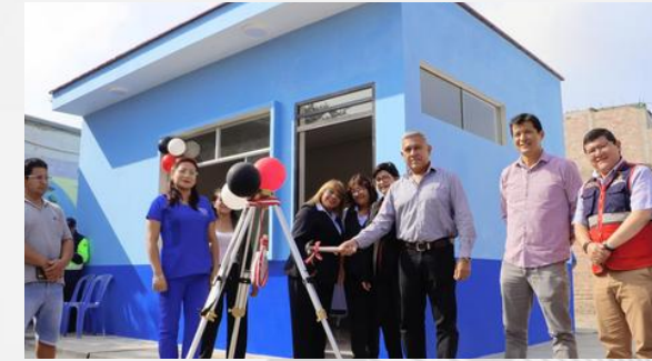
CENTRO DE SALUD MENTAL ESCOLAR INSTITUCIÓN EDUCATIVA N°20793 "LIBERTADOR Don José de San Martín" - Retes