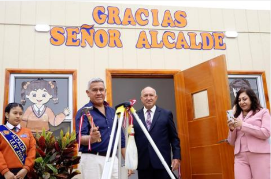
MODULO DE SALUD MENTAL ESCOLAR INSTITUCIÓN EDUCATIVA N°21559 "Antonio Graña Elizalde" - C.P. Huando