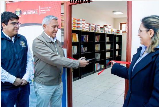
CENTRO DE SALUD MENTAL ESCOLAR Institución Educativa N°20403 - Carlos Martínez Uribe.