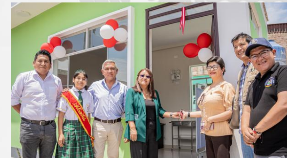
CENTRO DE SALUD MENTAL ESCOLAR Institución Educativa N°20396 "Antonio Arellano Buitrón" - C.P. Cabuyal.