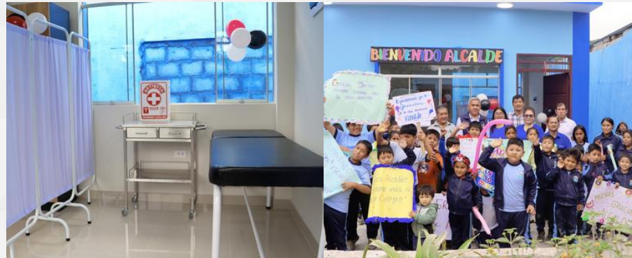
CENTRO DE SALUD MENTAL ESCOLAR Institución Educativa N°20448 "Nuestra Señora de la Esperanza" - Esperanza Central