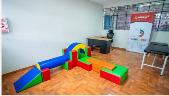
AULA DE CONSEJERÍA DE DESARROLLO PSICOLÓGICO Y COGNITIVO Centro de Educación Básica Especial N° 02 "Juan Ishizawa Ishizawa"