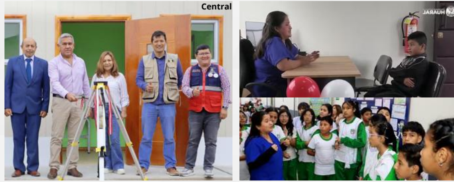
MODULO DE SALUD MENTAL ESCOLAR INSTITUCIÓN EDUCATIVA N° 20407 "Los Naturales" INSTITUCIÓN EDUCATIVA N° 21009 LUIS Felipe Subauste del Río