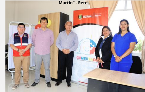
CENTRO DE SALUD MENTAL ESCOLAR 20405 "SALVador de las Casas Dulanto" - Huaca